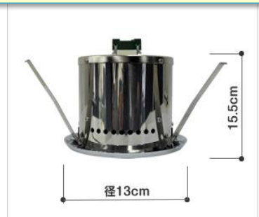
KO-104G 6~15畳用 天井埋込型

W11.1・D13.7・H28.8cm/1810g 希望小売価格 ¥138,000円 (消費税: ¥6,900円) 合計金額 ¥144,900円